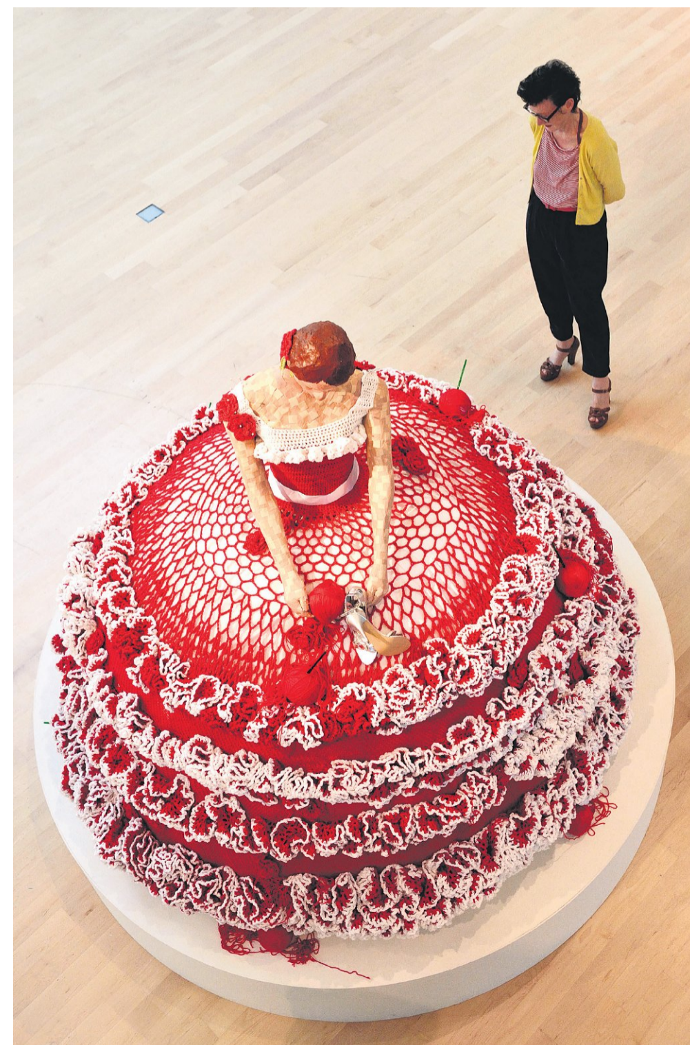
Pepón Osorio: Drowned in a Glass of Water', 2010, installatie (detail)