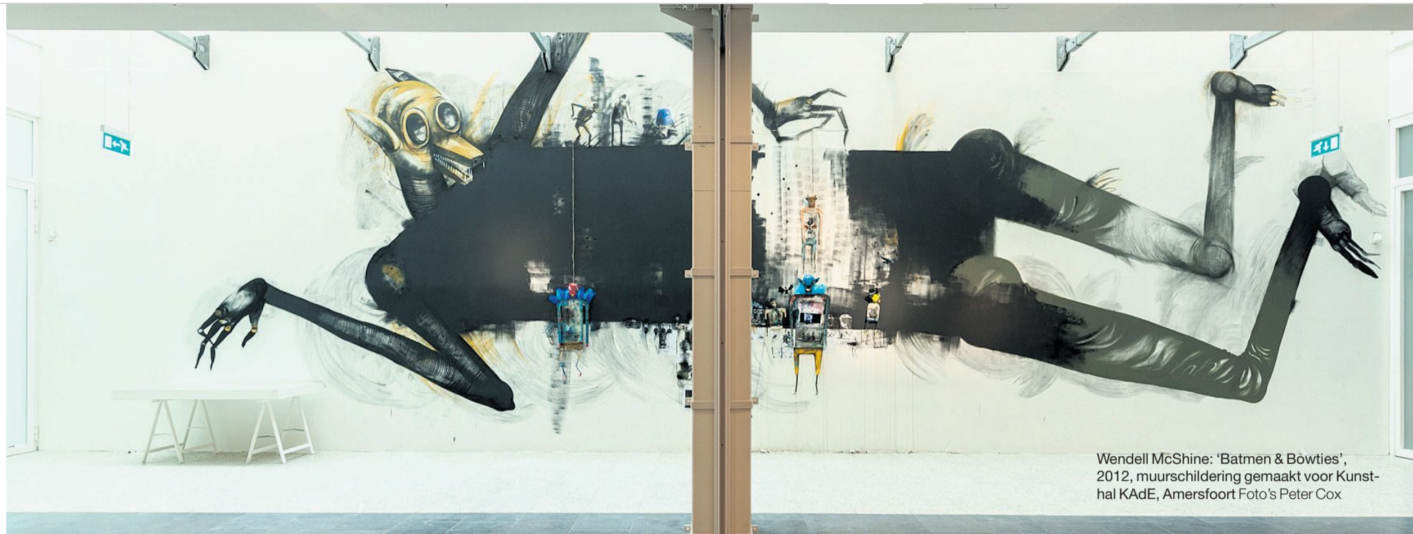
Wendell McShine: 'Batmen & Bôwties', 2012, muurschildering gemaakt voor Kunsthal KAdE, Amersfoort